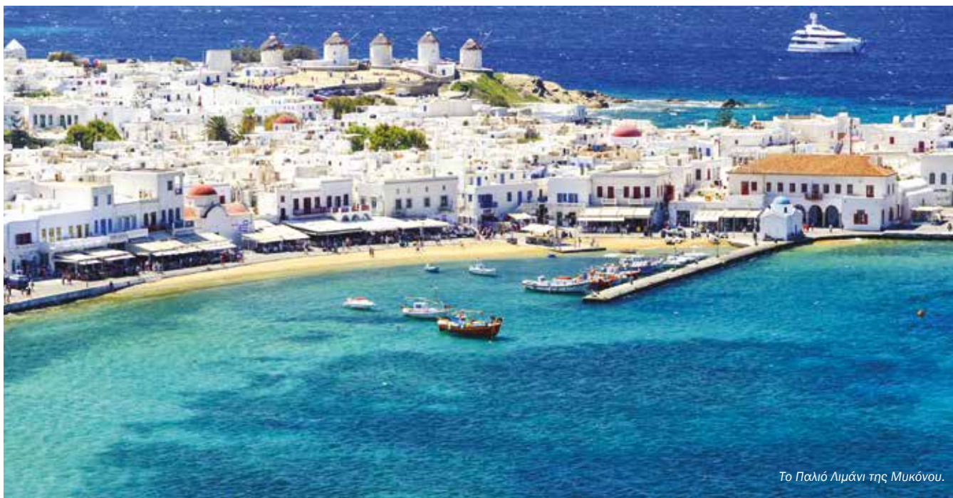
Το Παλιό Λιμάνι της Μυκόνου.

Όλες οι Εγκαταστάσεις Επεξεργασίας Λυμάτων έχουν υποστεί βαριές εργασίες συντήρησης, ενώ ο λεπτομερής σχεδιασμός δίνει τη δυνατότητα είτε για τη σύνδεση με το Δημοτικό Δίκτυο Αποχέτευσης είτε για την κατασκευή νέων εγκαταστάσεων υψηλών προδιαγραφών.