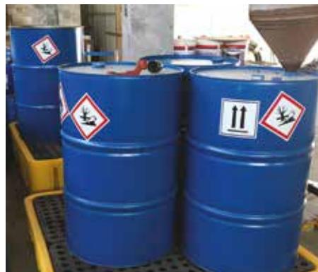
Βαρέλια για την αποθήκευση χρησιμοποιημένων ελαίων σε εσωτερικό χώρο. Τα χρησιμοποιημένα έλαια αποστέλλονται προς ανακύκλωση δια μέσω του αντίστοιχου Συστήματος Εναλλακτικής Διαχείρισης.

Ενημερωτικά αυτοκόλλητα τοποθετήθηκαν σε κάθε δοχείο προς ενημέρωση του προσωπικού για το περιεχόμενο και την επικινδυνότητά του.