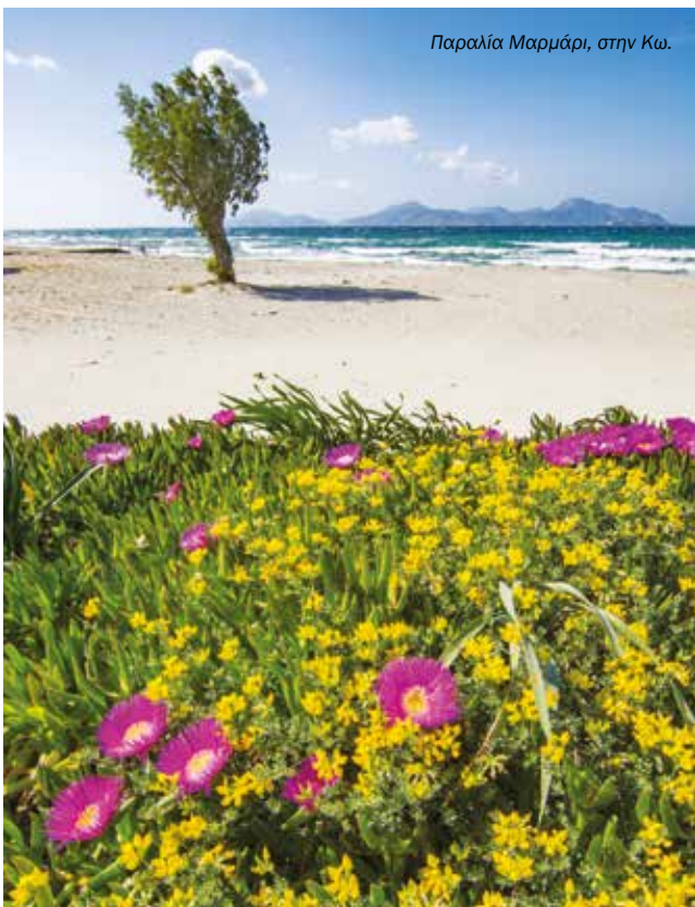
Παραλία Μαρμάρι, στην Κω.

Η παρουσία ορισμένων ειδών άγριας ζωής (πτηνά μεγάλου μεγέθους ή πτηνά που πετούν σε σμήνη, αλεπούδες) στα αεροδρόμια μπορεί να θέσει σε σημαντικό κίνδυνο την ασφάλεια των αεροσκαφών.