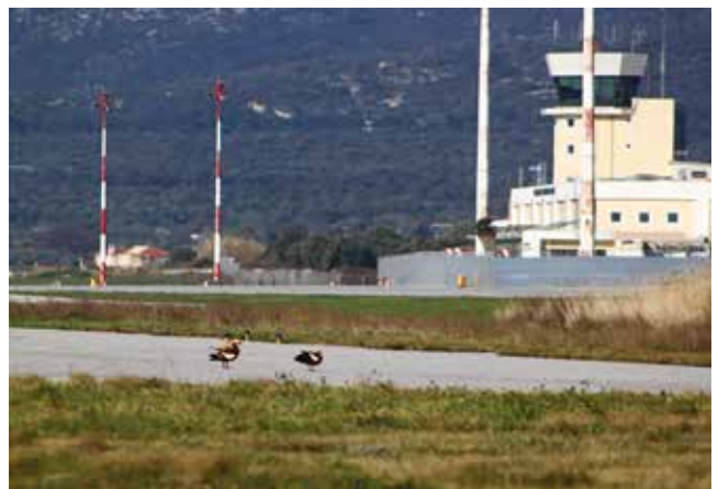
Καστανόπαπια ( Tadorna ferruginea ) στον Αερολιμένα Σάμου.