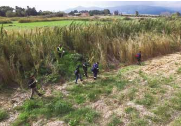
Πρώτη φάση απομάκρυνσης του τσακαλιού από τον Αερολιμένα Σάμου (12/03/2018).

Η πρώτη αυτή προσπάθεια δεν απομάκρυνε αμέσως τα τσακάλια από το αεροδρόμιο, αλλά ήταν επιτυχής καθώς αποκάλυψε νέες φωλιές των τσακαλιών, οι οποίες τέθηκαν υπό παρακολούθηση μέχρι την άνοιξη. Αυτή ήταν ουσιαστικά η τελευταία ευκαιρία για την απομάκρυνση των τσακαλιών από το αεροδρόμιο πριν την γέννηση των μικρών και πριν από την ολοκληρωτική απομάκρυνσή τους το φθινόπωρο του 2018. Η απομάκρυνση θα είναι πιο αποτελεσματική με την ολοκλήρωση των εργασιών κοπής χόρτων στο αεροδρόμιο.