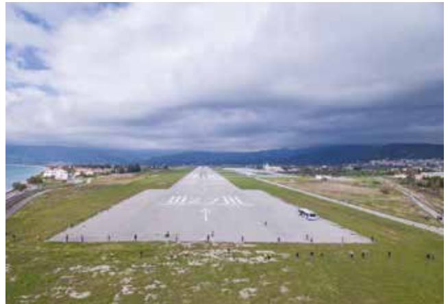
Πρώτη φάση απομάκρυνσης του τσακαλιού από τον Αερολιμένα Σάμου (12/03/2018).

Άλλη μια σημαντική στιγμή από τις έρευνες που γίνονται από τους ορνιθολόγους στο αεροδρόμιο, είναι η παρατήρηση της Καστανόπαπιας ( Tadorna ferruginea ).