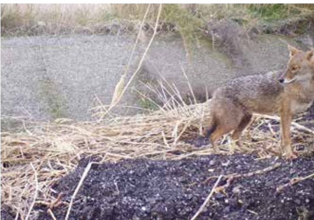
Χρυσό τσακάλι εντός του Αερολιμένα Σάμου (Μαΐος 2017, Αρχιπέλαγος και FG).