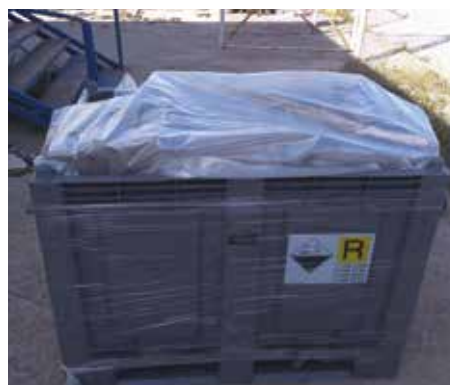
Μεγάλες μπαταρίες έτοιμες να αποσταλούν για ανακύκλωση.