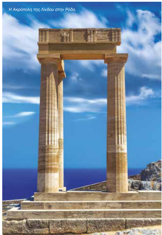
Η Ακρόπολη της Λίνδου στην Ρόδο.