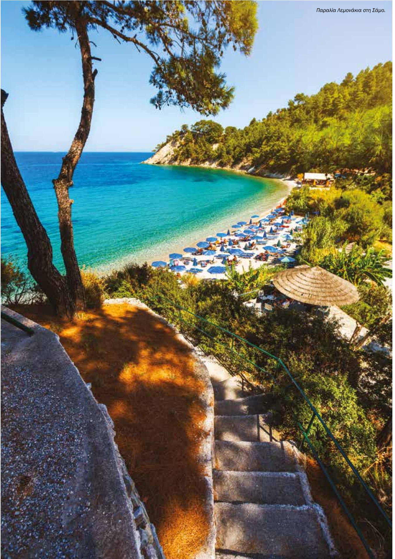
Παραλία Λεμονάκια στη Σάμο.